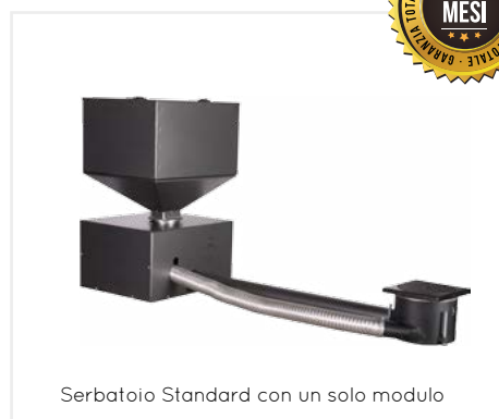
Serbatoio Standard con un solo modulo