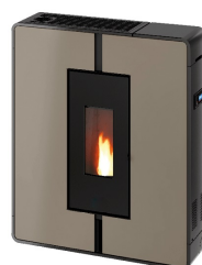
Metallo light bronze