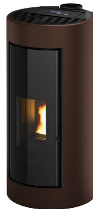
Metallo dark bronze