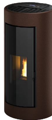
Metallo dark bronze