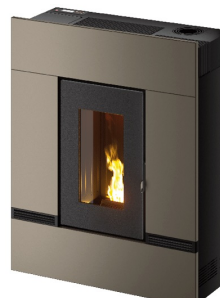
Metallo light bronze