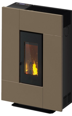
Metallo Light Bronze