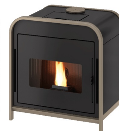
Metallo light bronze